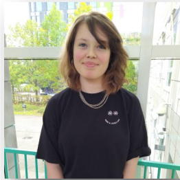
Sita på Center for Hjerneskade

Nu kan jeg gå selv igen. På nogle måder er jeg nu også mere selvstændig. Det har hjulpet mig meget at gå her.